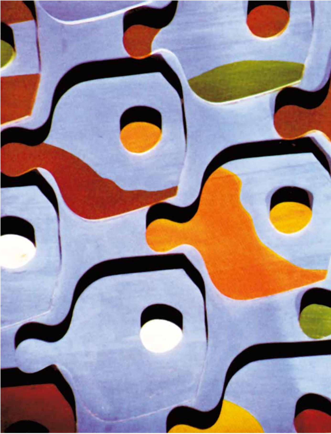
Hans Arp, „Das Eierbrett“, 1922