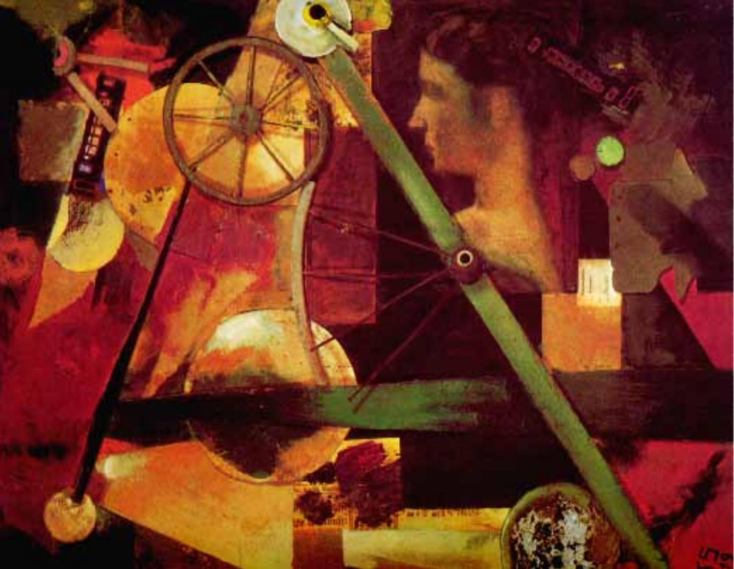
Merzbild 10 A / L Merzbild L4 (Konstruktion für edle Frauen), 1919